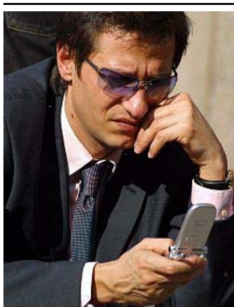
Auf jede Frage gibt es jetzt Antworten per SMS.